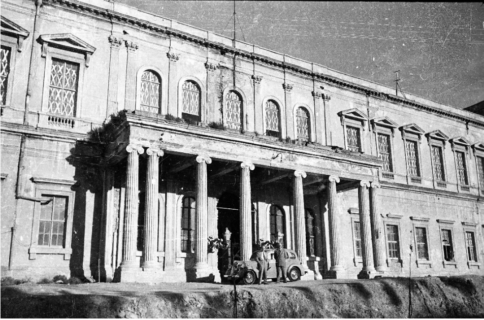
Resim 7. İTÜ'ye tahsis edilen Taşkılla

Devlet karşısında iki mimarlık okulunun konumları hakkında şu tespiti yapmak gerekir: 1930'lu yıllarda yeni kurulan YMM'deki şubenin kapatılarak GSA'ya bağlanması teklif edilirken 1940'lı yıllardan itibaren bağlanma girişimlerinin yönü değişir. Bu değişim 1940'ta Onat'ın YMM Şube Şefi olması ve 1941'de YMM'nin Maarif Vekaleti'ne devredilmesi sonrasında başlamış görünmektedir. Uzun yıllar GSA Mimari Şubesi/Bölümü şefi olan Sedat Hakkı Eldem (1983, 13) bu süreci "Akademinin sönmesi paralelinde ... Y.Mühendis Mektebi ... ilerledi ve devletin nimetlerini kendine çekmeyi başardı." şeklinde ifade eder. Bu durum Maarif Vekili Hasan Âli Yücel'in teknik eğitime verdiği önem, İsmet İnönü'nün oğlunun okuduğu YMM ile yakından ilgilenmesi ya da İTÜ Mimarlık Fakültesi'nin kurucusu kabul edilen Emin Onat'ın devlet mensuplarıyla iyi ilişkiler kurabilmesi gibi pek çok farklı nedenle ilişkilendirilebilir. Devletin kısıtlı bütçesinden pay almak için kişisel ilişkilere ihtiyacın yarattığı öngörülemez ortamda YMM/İTÜ ve GSA'nın birleştirilmesi girişimleri, diğerine bağlanma tehlikesinde olan mimarlık okulunu, devlet karşısında kendi önemini ve işlevini tanımlamaya mecbur bırakır.