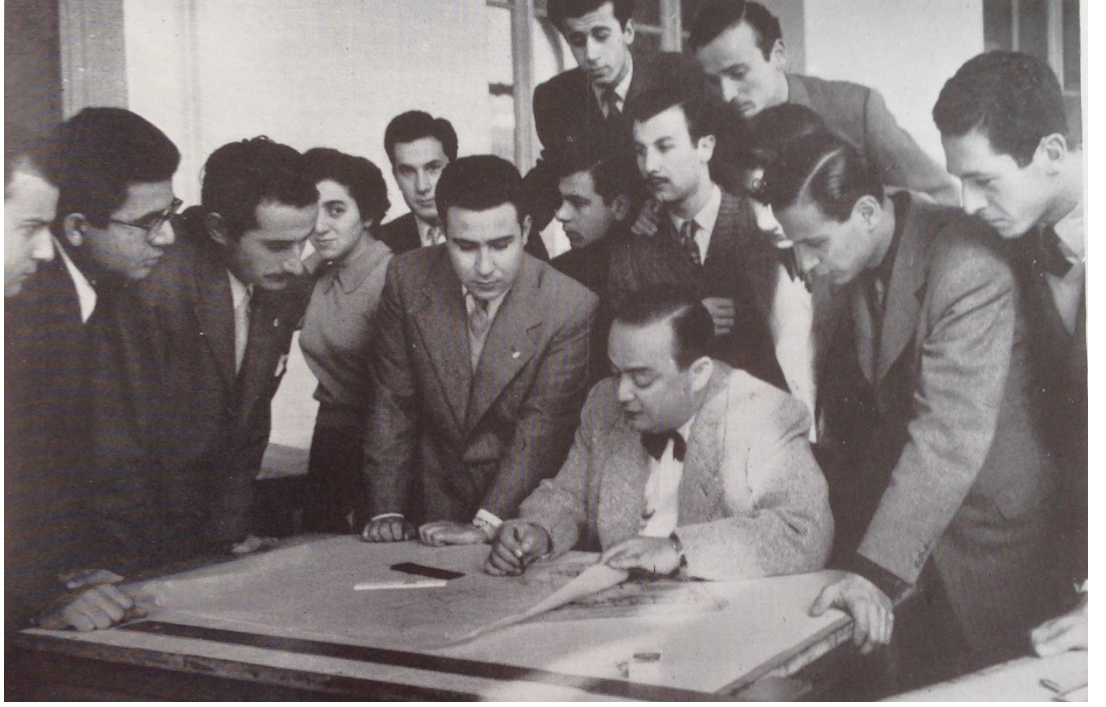
Resim 10. Emin Onat öğrencileriyle (Anonim, 1962, 61) Resim 11. Sedad Hakkı Eldem öğrencileriyle (Fotoğraf Albümü, 2010, 74)