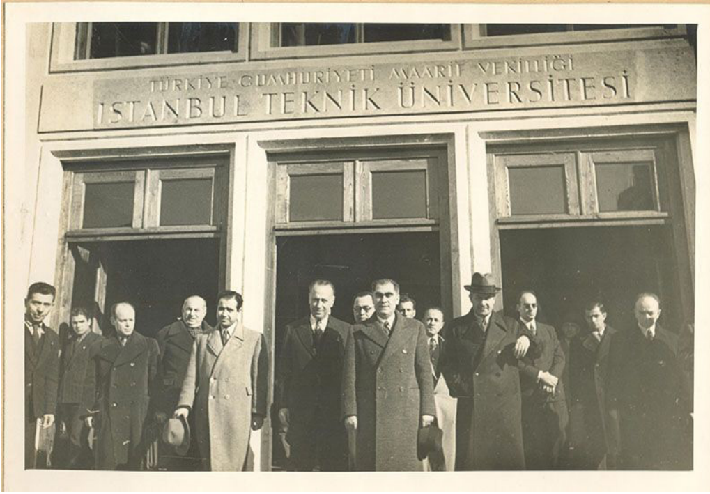
Resim 3. Milli Eğitim Bakanı Yücel İTÜ'nün açılışında, 1944 (Url-3)

Devletle kurulan ilişkinin niteliğinin bu denli kişisel ölçekte olması okulların gelişimleri için daha belirsiz bir ortam yaratarak aradaki çekişmeyi artırır. Örneğin YMM'nin İTÜ'ye dönüşümü, dönemin cumhurbaşkanı İsmet İnönü'nün oğlunun YMM'de öğrenci olmasına bağlanır. Bu dönemde GSA'da öğrenci olan Muhteşem Giray 7 (2003, 105-106) İsmet Paşa'nın, oğlunun Akademi'de mi Mühendis Mektebi'nde mi okuyacağına karar vermek için GSA'yı ziyaret ettiğini anlatır (Resim 4). Giray'a göre ziyaret sonrasında İnönü'nün, oğlunun YMM'ye gitmesine karar vermesi Teknik Üniversite kanununun çıkmasını sağlar. Giray, eğer tersi gerçekleşmiş olsaydı Akademi'nin kanununun çıkacağını söyler. Bu varsayım doğrulamayacak olsa da özellikle İTÜ ve GSA binalarının onarımı göz önüne alındığında tamamen haksız sayılamaz. İTÜ Mimarlık Fakültesi mensubu Orhan Safa (1995, 92) Taşkışla'nın İTÜ'ye tahsis edilmesinde ve yenilenmesinde İsmet İnönü'nün etkisine dikkat çeker. Safa'ya göre oğlunun İTÜ'de öğrenci olması nedeniyle İnönü Taşkışla'nın İTÜ'ye tahsis edilmesi isteğinin yerine getirilmesi emrini vermiş ve okulla yakından ilgilenmiştir. Öte