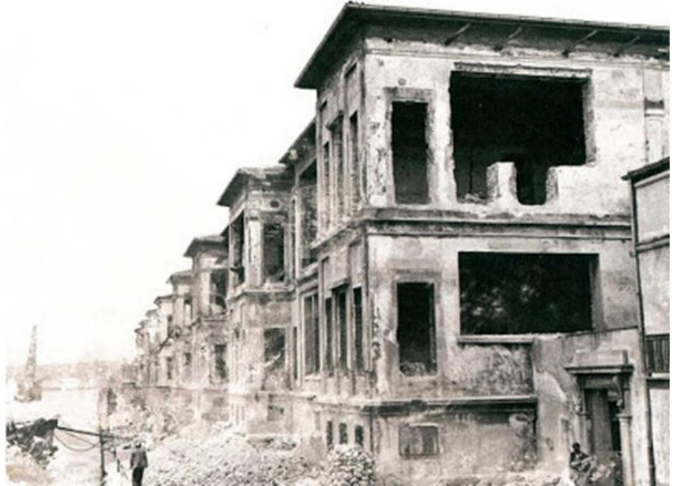
Resim 6. Yangın sonrasında GSA Binası (Url-5)

— Adın, güzel sanatlar mı dedin? Evet, evet şimdi hatırlar gibi oluyorum... Fakat ne kadar cılızsın; kimsen yok mu senin? (Güzel Sanatlar'dan)