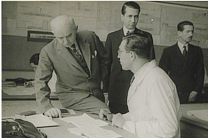
7. 1947 GSA mezunu.