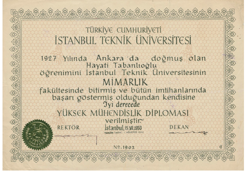
Resim 9. Hayati Tabanlıoğlu'nun İTÜ Mimarlık Fakültesi Diploması, 1950, (Salt Araştırma Tabanlıoğlu Ailesi Arşivi, Url-8)

Öte yandan İTÜ mezunlarının “mühendis-mimar” unvanını kullanması GSA mezunlarından farklılık ifade ettiği ve bir üstünlük göstergesi olarak algılandığı için rahatsızlık yaratır. Türkiye Yüksek Mimarlar Birliği’nin (1946, 41) 1946’daki çalışma raporunda şöyle denmektedir: “Teknik Üniversiteden mezun olanlar Y. Mühendis-mimar unvanını kullanıyorlar. Vakıa bu unvan henüz kanuni şekilde tanınmıyorsa da bu arkadaşlar bu unvanı benimsemişlerdir...”. Raporda bu unvanı kullananların daha iyi bir eğitim aldıkları algısının yanlışlığı belirtilerek hangi okuldan mezun olunursa olunsun mimar unvanının kullanılması önerilir.