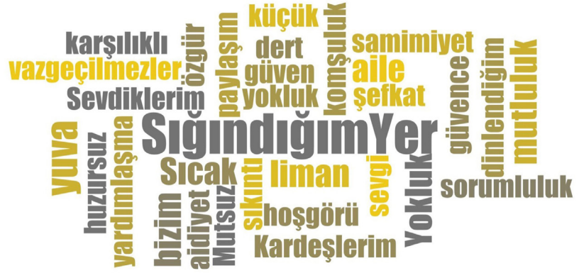
Şekil 3. Çocukluk yaşlarında evin anlamına ilişkin kelimelerin frekans analizi.

“yokluk” kelimesi yer almaktadır. Bu ifade de “yokluk/mutsuzluk” temasında gruplanmıştır (Şekil 3).