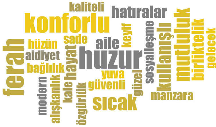
Şekil 5. Mevcut evi tarifleyen kelimelerin frekans analizi.

ve “mutluluk” ifadeleridir. “Sıcak” kelimesi konfor koşullarına bağlı olarak olumlu bir fiziksel özelliktir. “Mutluluk” ifadesi ise evde yaşananlara bağlı olarak evin kullanıcıya hissettirdiği olumlu bir psiko-sosyal özelliktir. Üçüncü sırada da “kullanışlı”, “birlikte”, “aile”, “hayat” ve “anılar” kelimeleri/kavramları yer almaktadır. “Kullanışlı” ifadesi olumlu bir fiziksel özellik iken, diğer ifadeler olumlu psiko-sosyal özelliklerdir (Şekil 5).